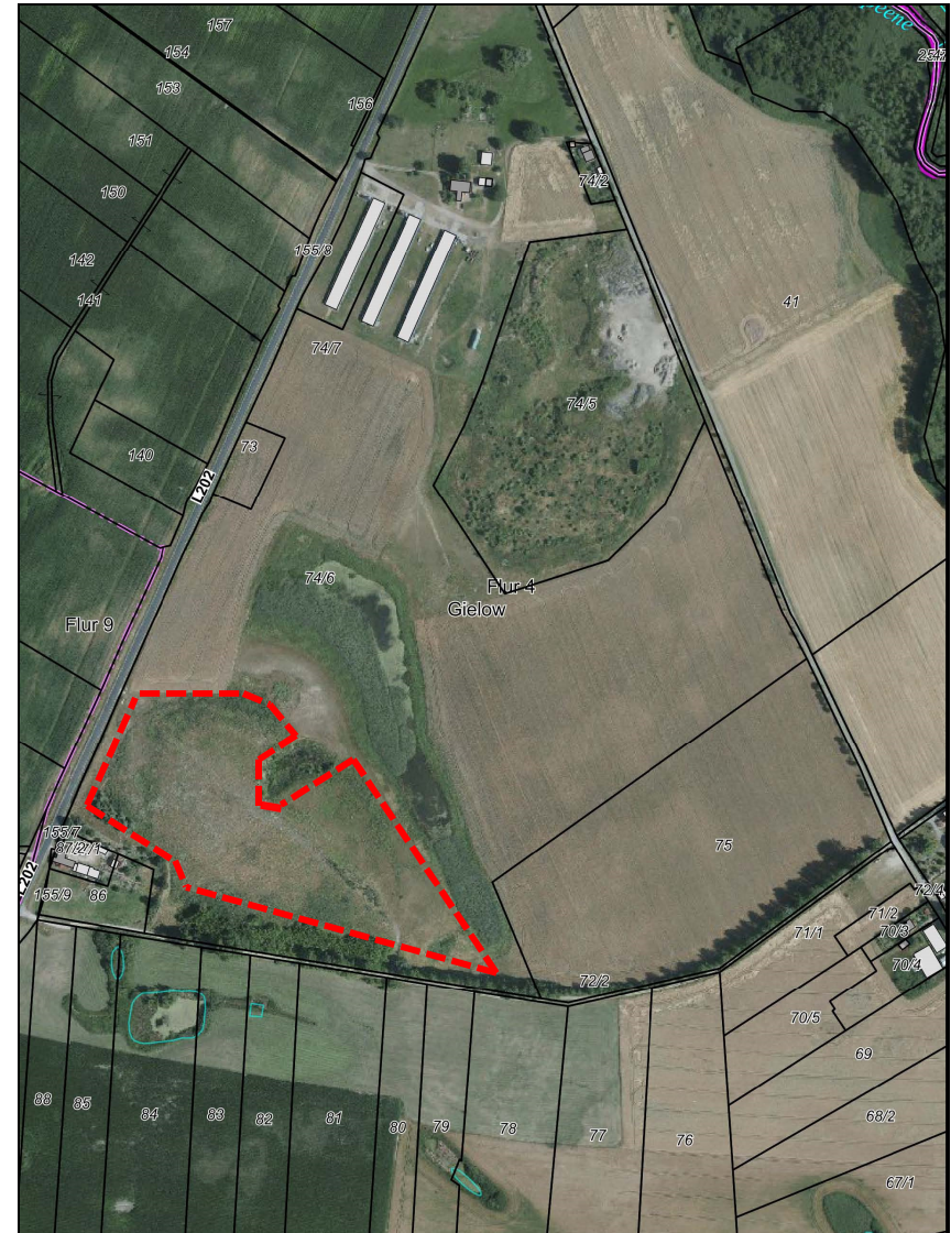
Lageplan mit Geltungsbereich des B-Plans Nr. 4

„Photovoltaik-Anlage Kieswerk Peenhäuser“