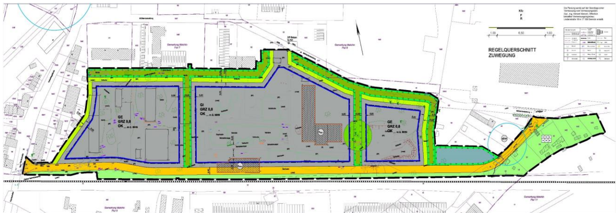
Abbildung 1: Planzeichnung Geltungsbereich

Für das Plangebiet werden entsprechend der Planungsziele des Bebauungsplanes Nr. 34 „Revitalisierung des ehemaligen RAW-Geländes“ nach § 8 BauNVO als Gewerbegebiet und ein nach § 9 BauNVO als Industriegebiet dargestellt.