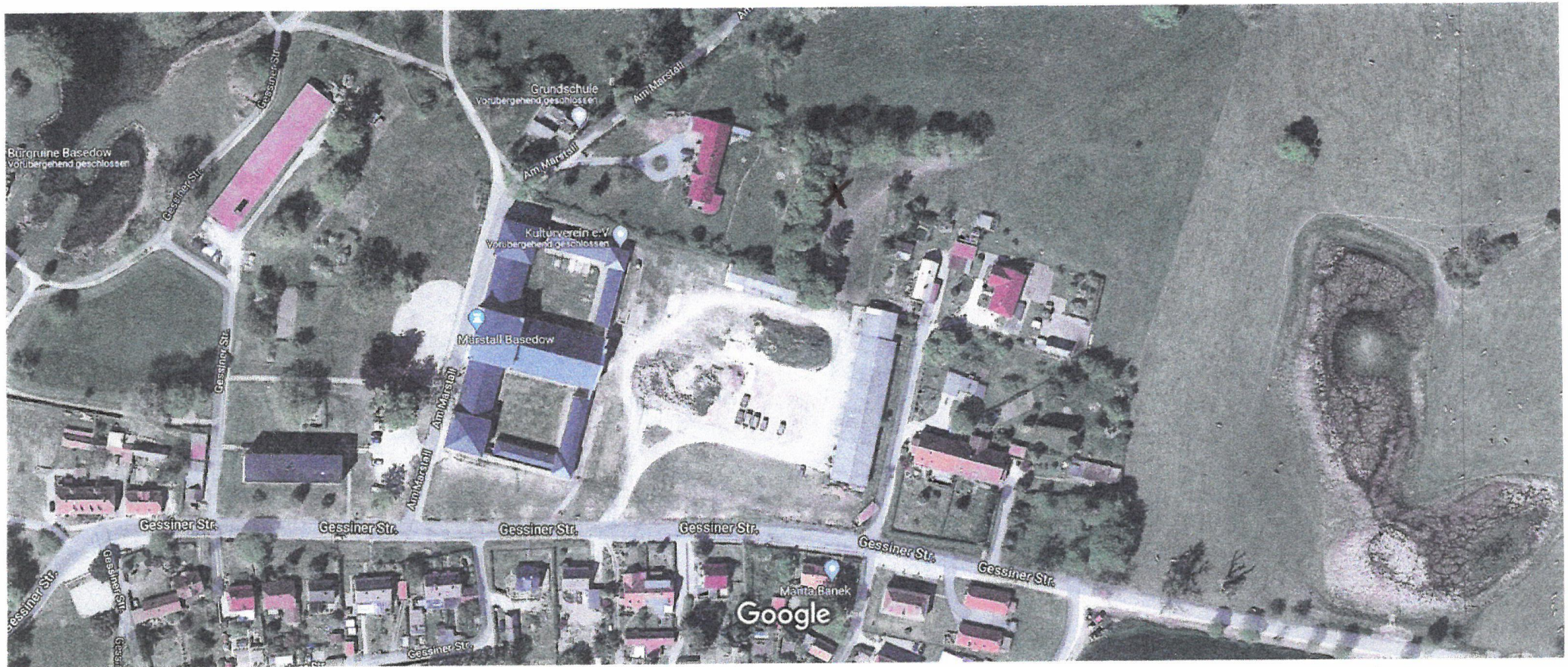
20 m