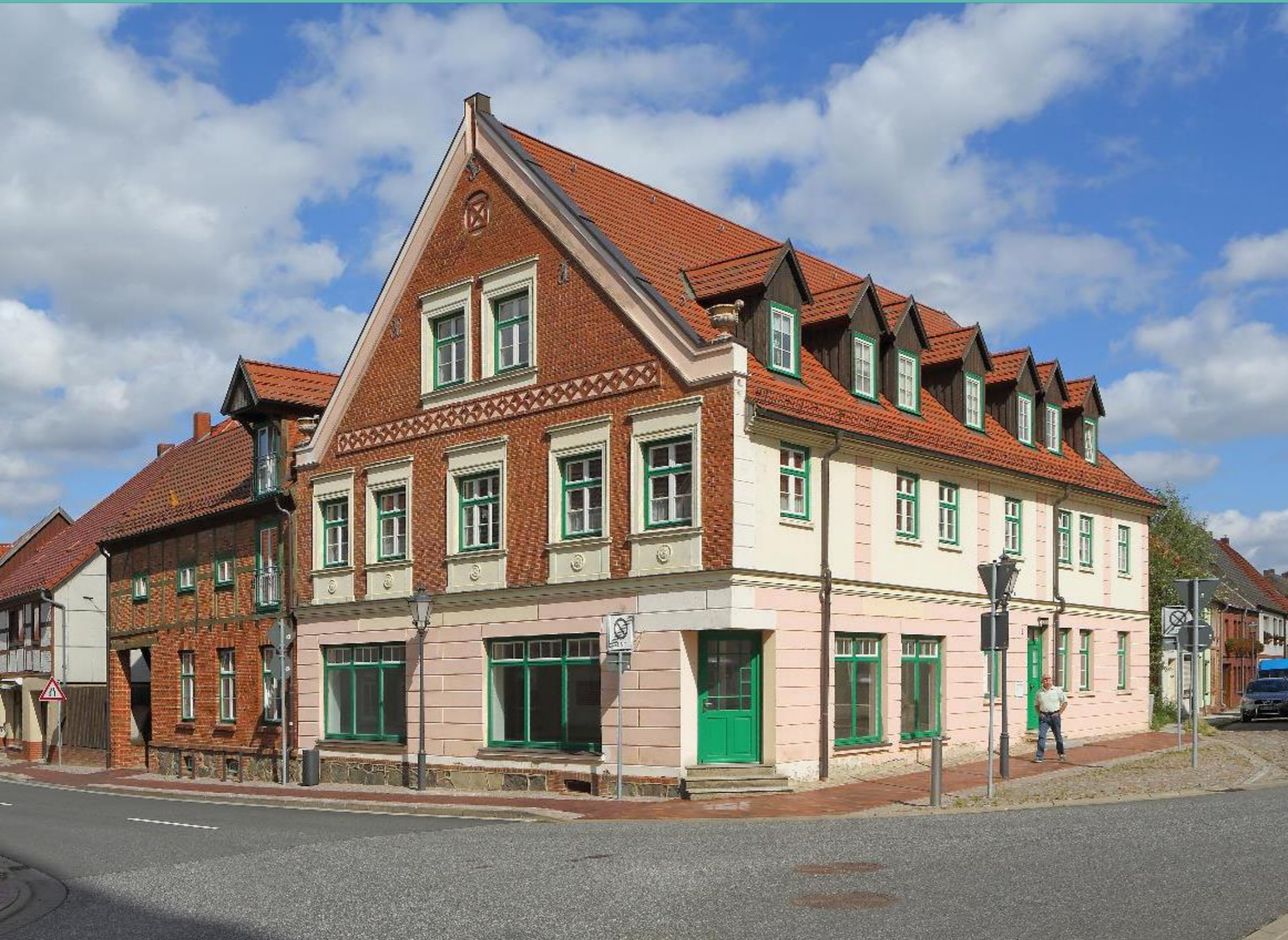
Markt – Westseite mit Blick auf das Haus am Markt Nr. 2