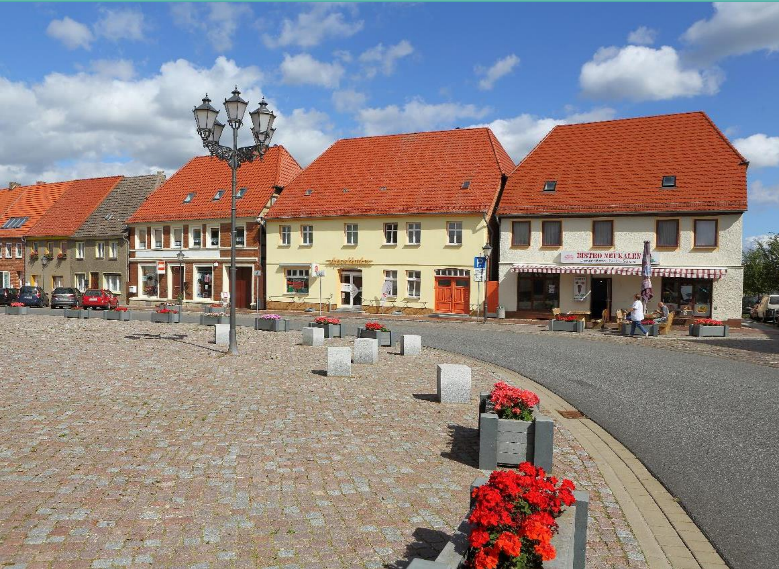
Markt - Ostseite