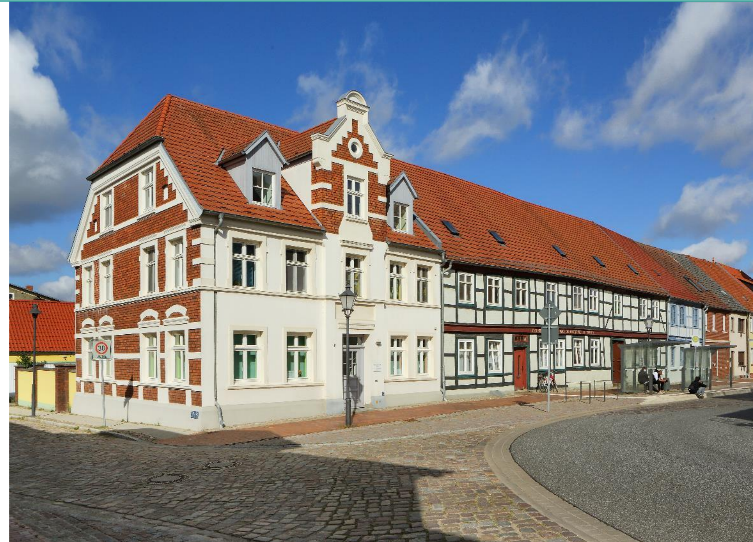
Markt - Westseite