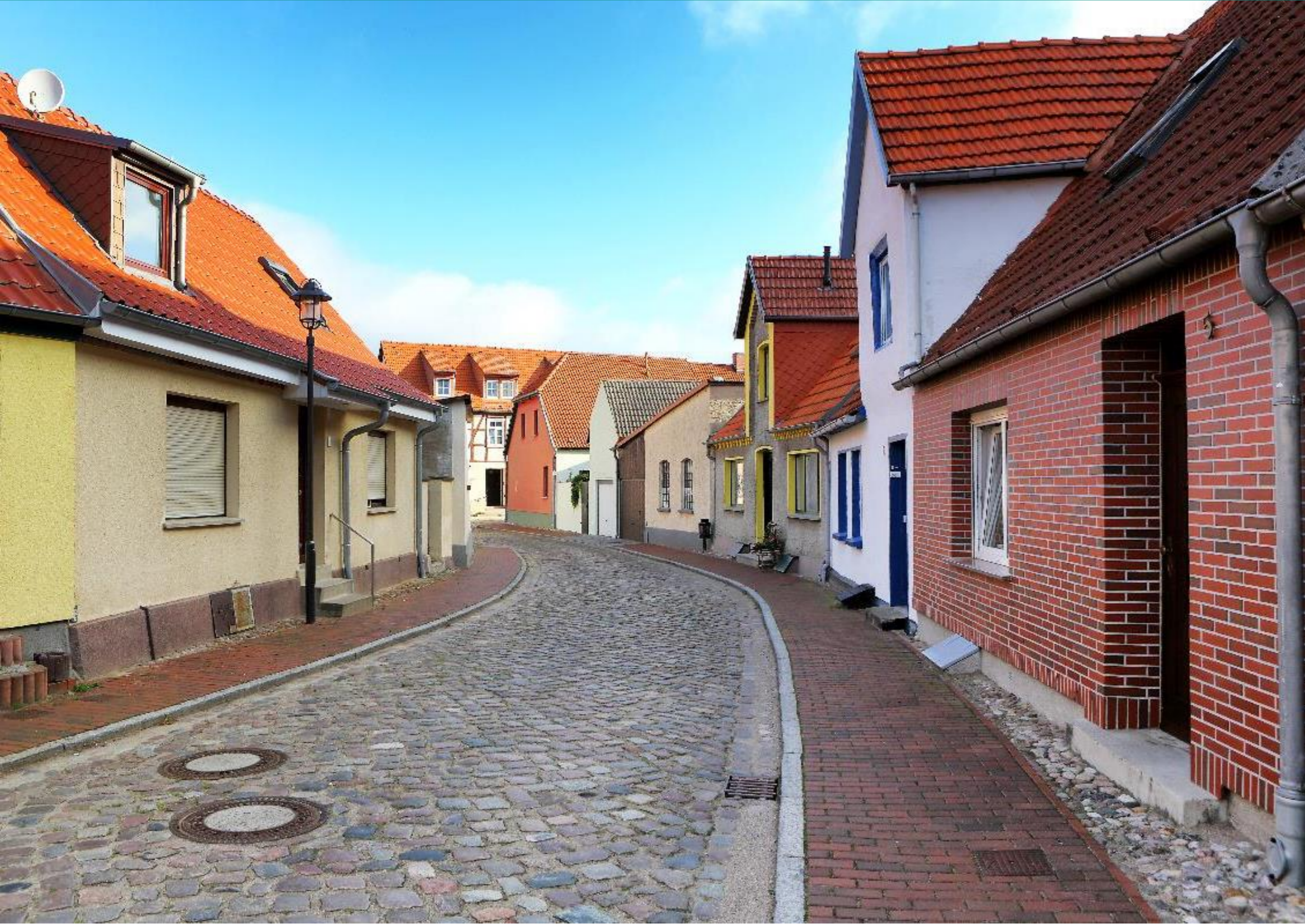
Ringförmig verlaufende Krumme Straße mit meist eingeschossiger Bebauung