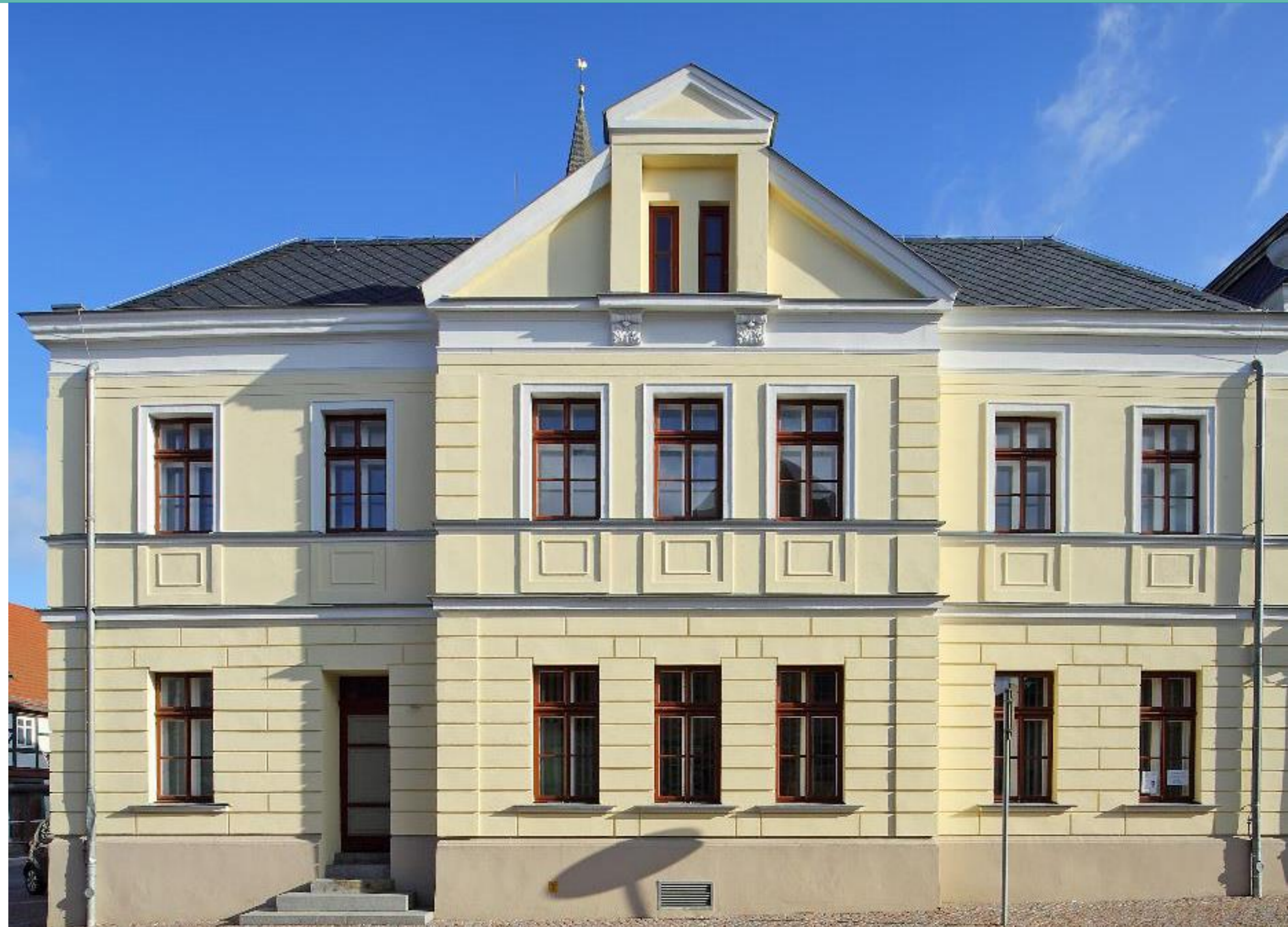
Markt – Südseite mit Blick auf das Rathaus