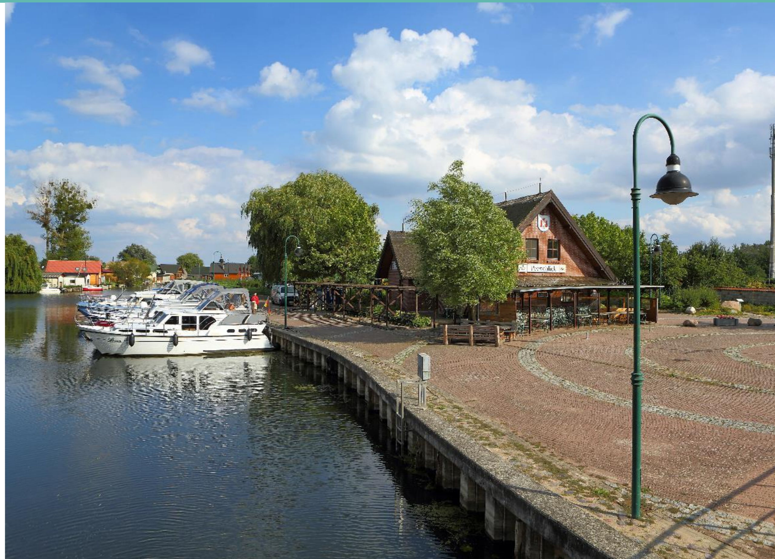
Hafen am Peenekanal