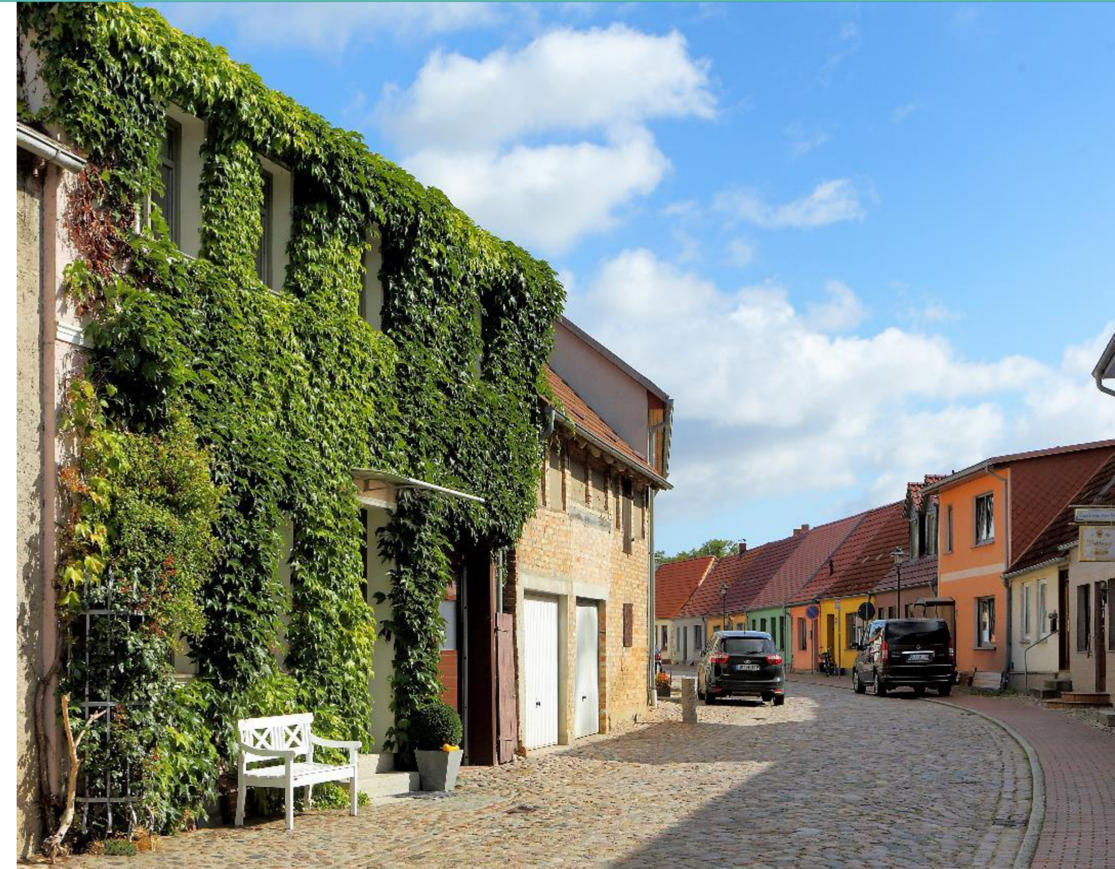
Blick in die Wallstraße