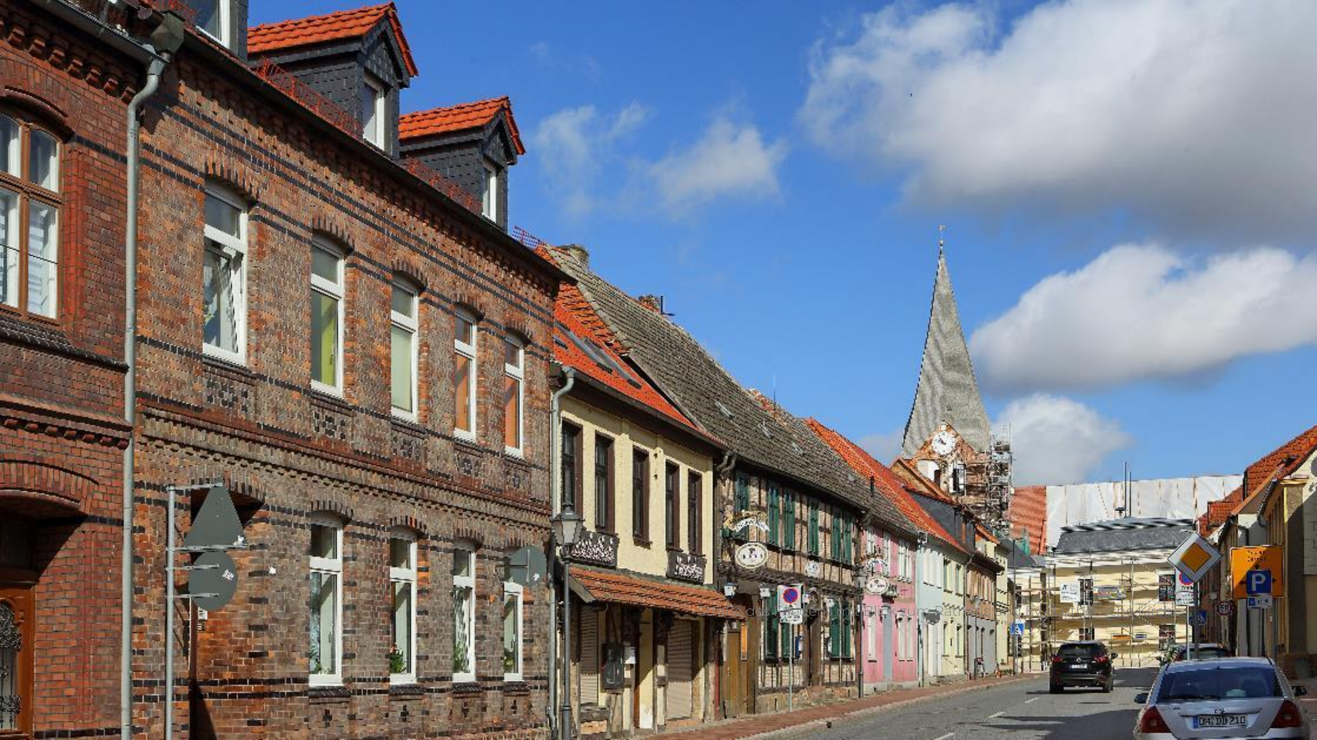
Straße des Friedens mit Blick zum Patronsberg, Eya, lutherische Kirche