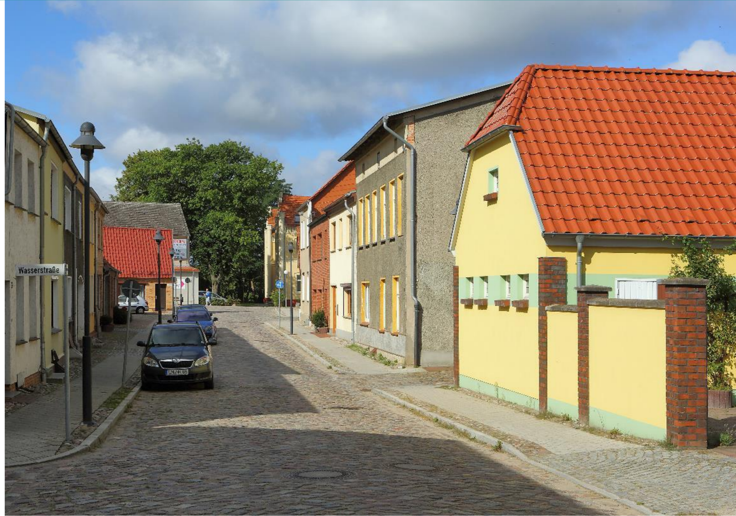
Blickachse Lutherstraße - Wasserstraße