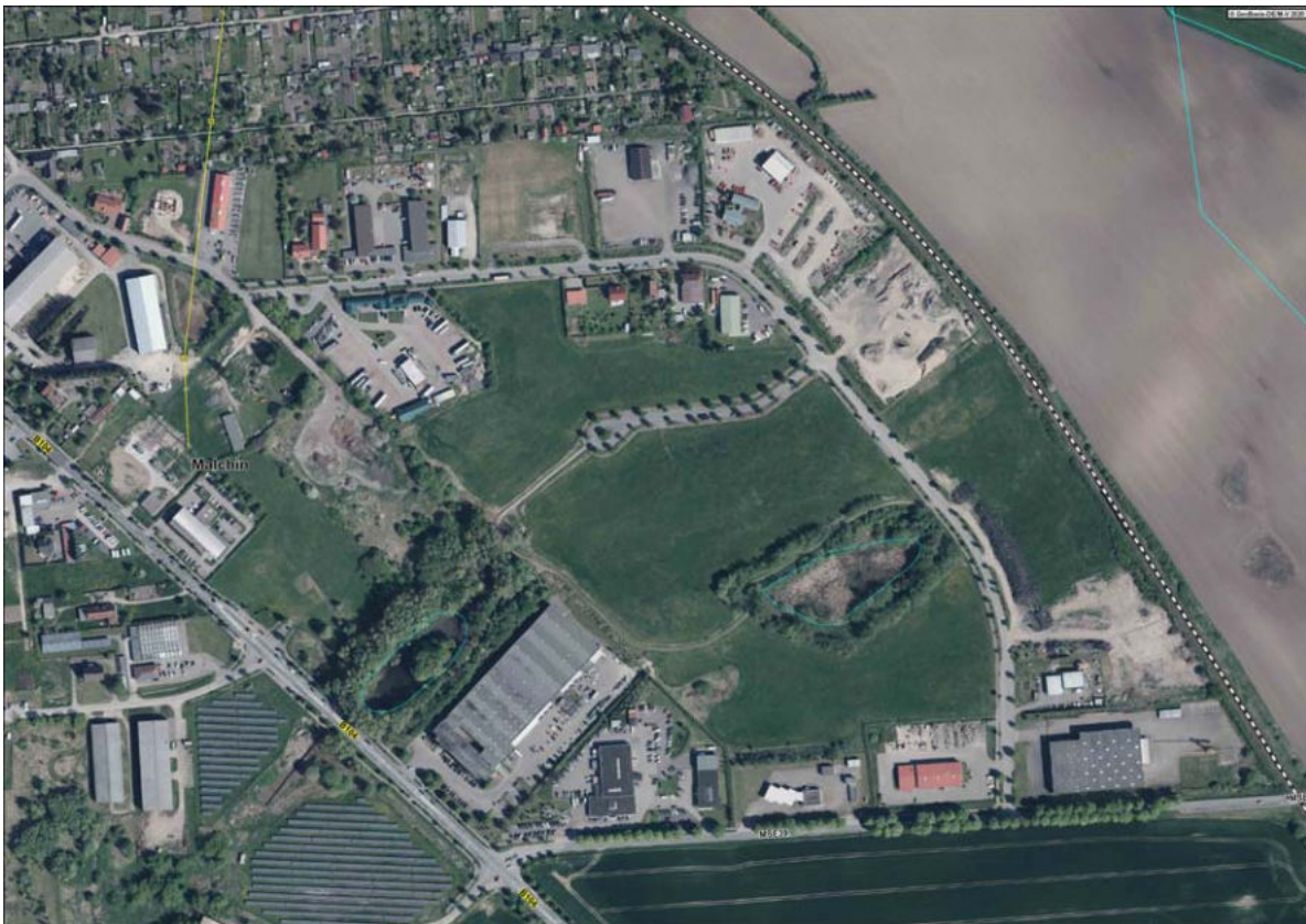
Abb. 1: Luftbild mit dem Planungsgebiet und Umgebung (Mai 2018)

Das folgende Luftbild zeigt das Plangebiet und dessen Umgebung im Mai 2018.