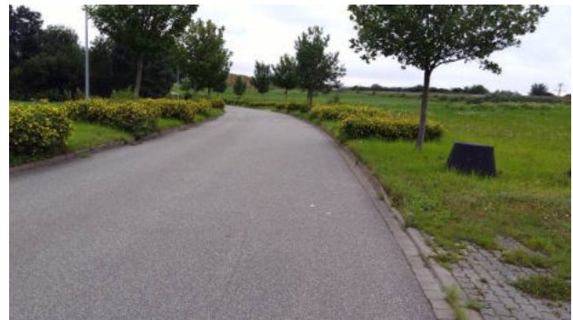
Abb. 3 und 4: Reifenlageraltlast im südöstlichen Teil des Plangebietes und Straße „Mühlenfeld“