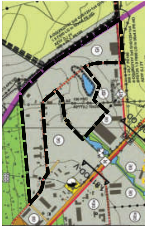
Auszug aus dem rechtswirksamen Flächennutzungsplan der Stadt Malchin - Ortslage Malchin