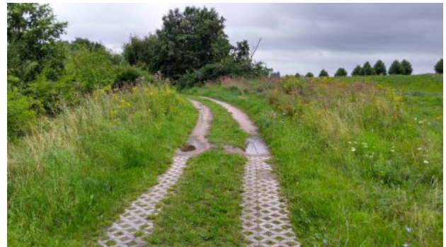
Abb. 5 und 6: Blick auf das Kleingewässer mit Ufergehölzen (geschütztes Biotop) und Weg am nördlichen Rand des geschützten Biotops