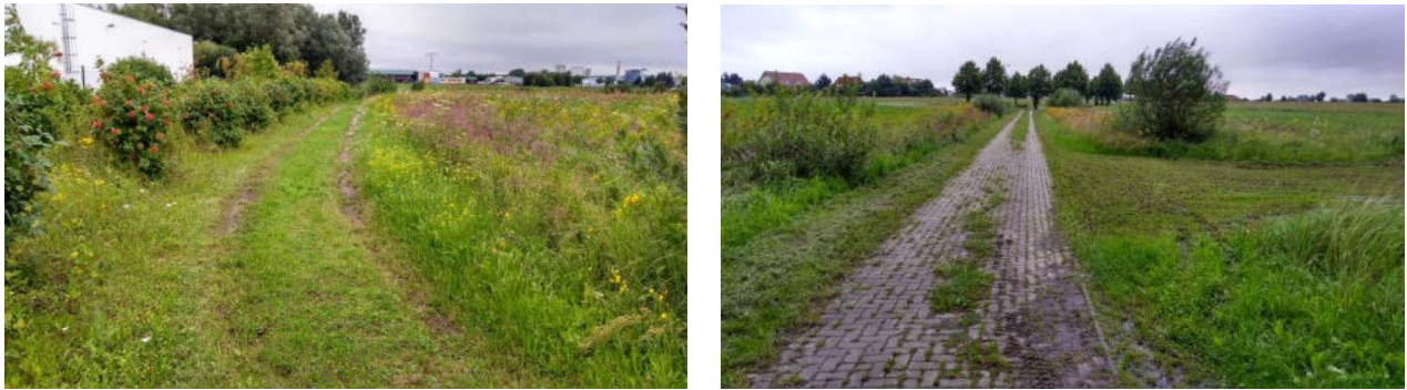
Abb. 7 und 8: Ziergehölze am südwestlichen Rand des Plangebietes und Weg, der von der Stichstraße Richtung Südwesten führt

Gemäß den Angaben der Stellungnahme des Forstamtes Stavenhagen vom 10.04.2018 und der ergänzenden E-Mail vom 26.06.2018 handelt es sich bei dem südwestlich an das Plangebiet angrenzenden Regenrückhaltebecken, das teilweise von Bäumen und Sträuchern umgeben ist, um eine Waldfläche entsprechend § 2 Landeswaldgesetz M-V (LWaldG M-V) (vgl. Abb. 2).