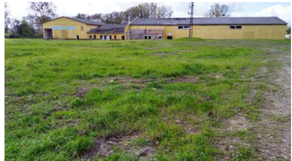
Abb. 8:und 9: Zuwegung zum Gebäude des ehemaligen Möbelmarktes und Freifläche davor

Der Plangeltungsbereich liegt ca. 4 m über NHN. Der Bereich ist weitgehend eben.