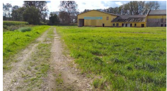
Abb. 6:und 7: nordöstlicher Rand und Erschließungsweg am südöstlichen Rand des Geltungsbereiches der 1. Änderung