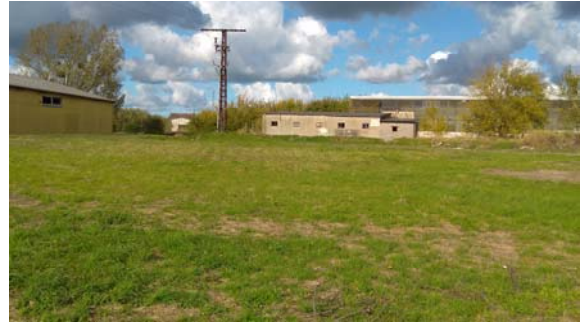
Abb. 4:und 5: leerstehendes Gebäude des ehemaligen Möbelmarktes und leerstehendes Nebengebäude am nordöstlichen Rand des Geltungsbereiches der 1. Änderung