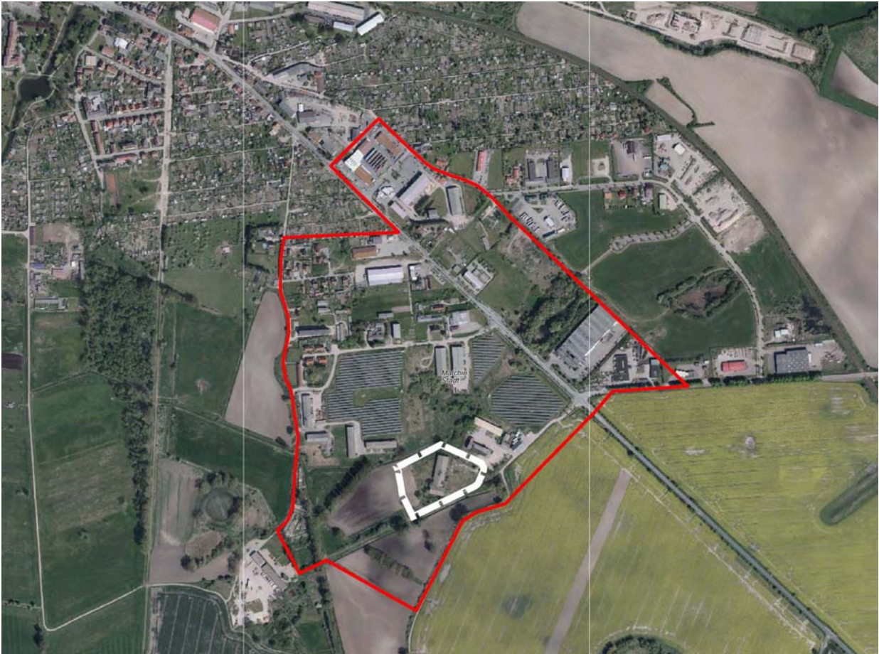
Abb. 1: Luftbild von Juni 2016 mit den Geltungsbereichen des B-Planes Nr. 7 und der 1. Änderung des B-Planes Nr. 7