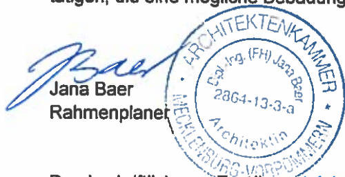
Jana Baer Rahmenplaner

Steuernummer 072/105/ 00167 USt-IdNr. DE137266866