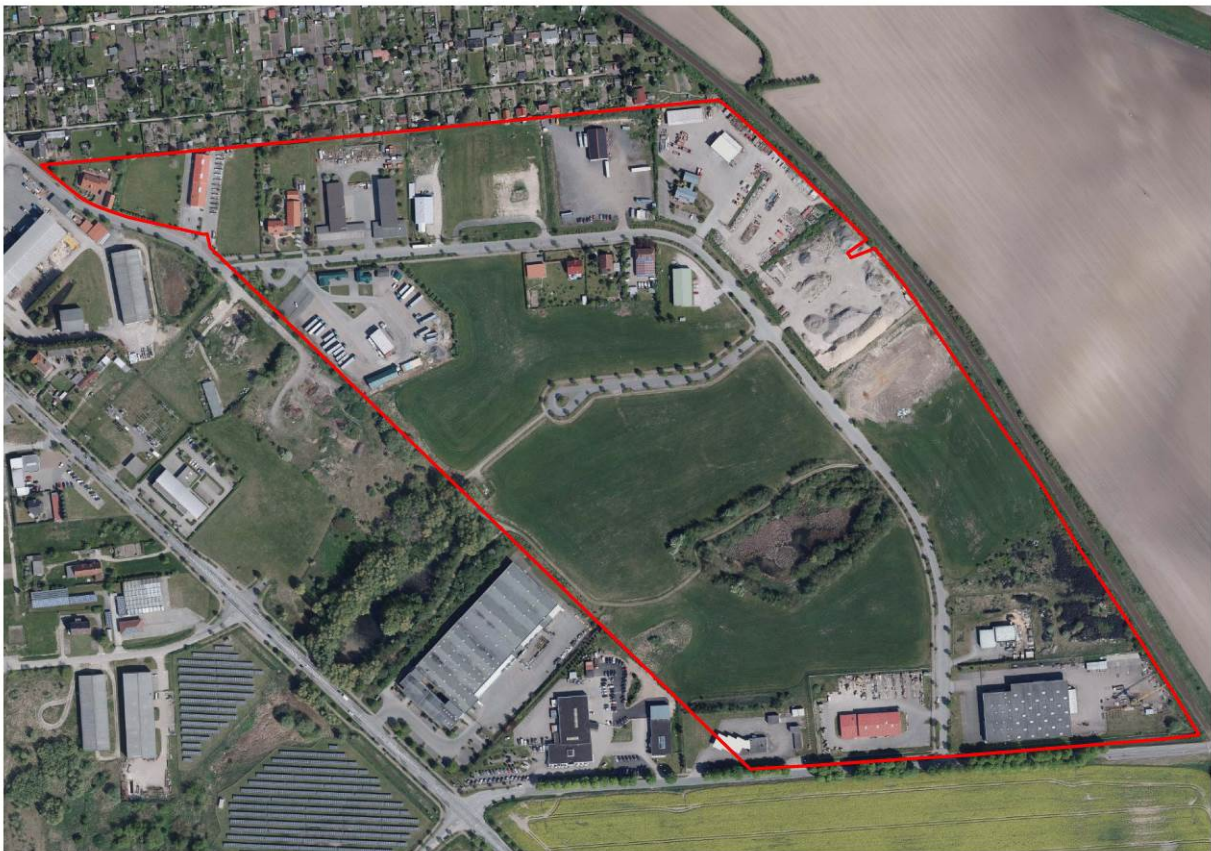
Abb. 1: Luftbild von Juni 2016 mit dem Planungsgebiet

Das folgende Luftbild zeigt das Plangebiet im Juni 2016.