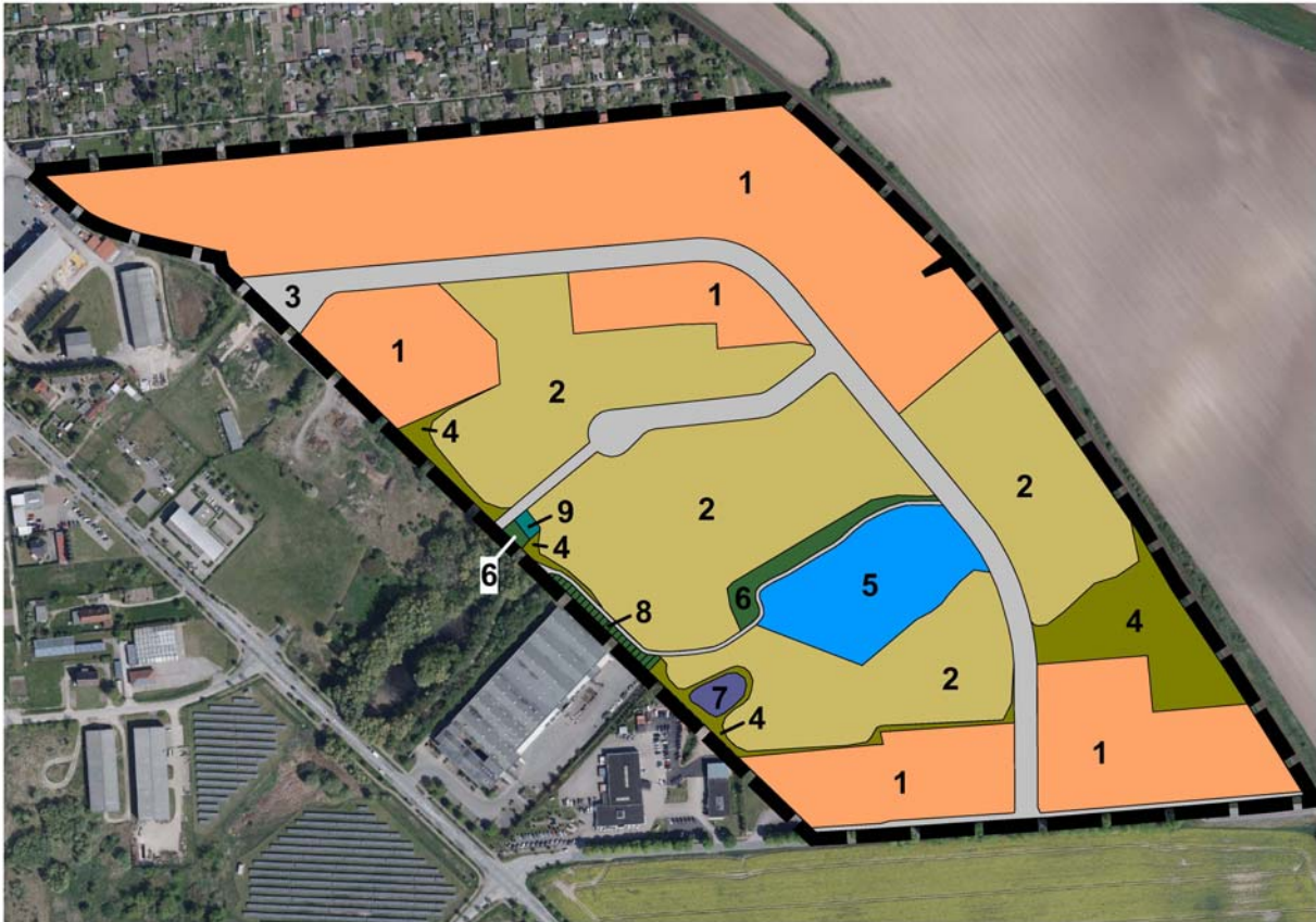
Abb. 2: Flächennutzungen und Biotoptypen im Plangebiet (Zuordnung der Zahlen: siehe oben)