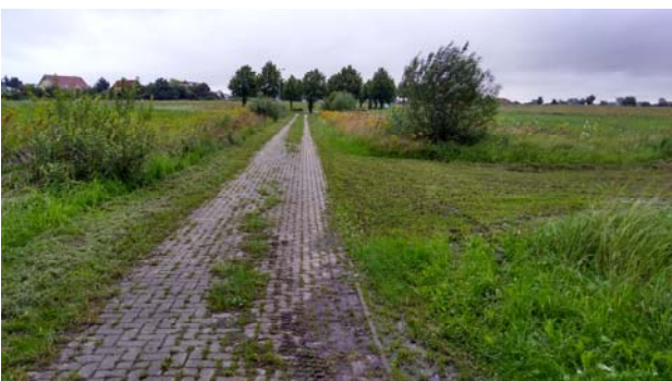
Abb. 7 und 8: Ziergehölze am südwestlichen Rand des Plangebietes und Weg, der von der Stichstraße Richtung Südwesten führt