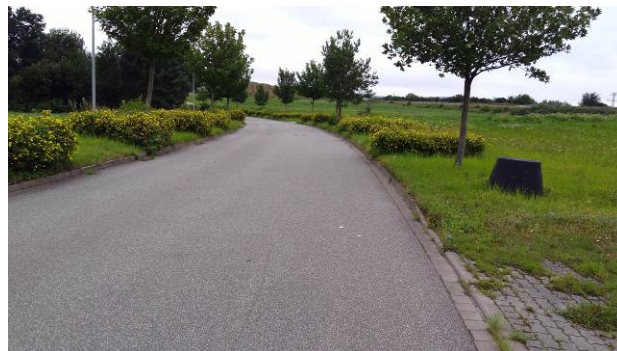
Abb. 3 und 4: Reifenlageraltlast im südöstlichen Teil des Plangebietes und Straße „Mühlenfeld“